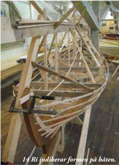
14 Ri indikerar formen på båten.

smala kvistfria och noggrant hyvlade smala träribbor (Ri) som sträcker sig från för till akter och bland annat markerar överkant på tänkta bord, samt skrovets form.