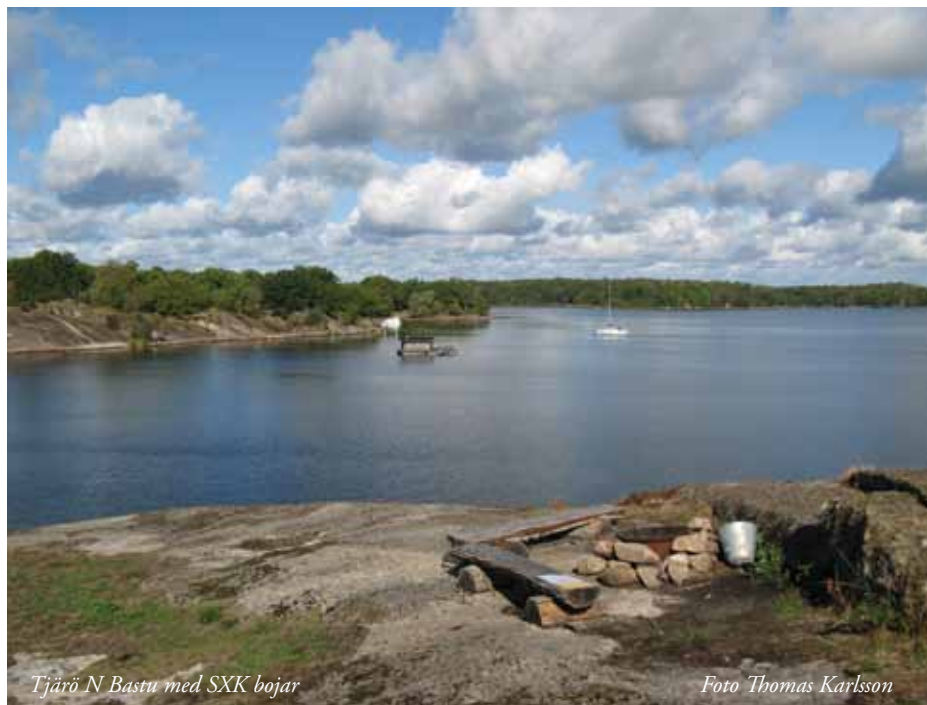
Tjärö N Bastu med SXX bojar