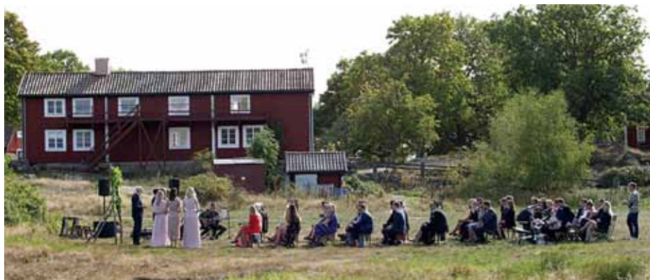
Bröllop på Tjärö

Ön finns omnämnd redan år 1659 då ett torp är dokumenterat. Om ordet ”Tjär” kommer av tjärbränning eller trädsamling, därom tvistar de lärde. Långt tillbaka skrevs ön ” Käröö”. Låt det betyda kärlek, med tanke på det vackra bröllop med ett femtiotal gäster som hölls på ängen i strålande solsken.