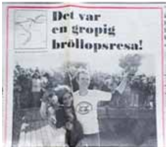
Bild från Sydsvenskans förstasida 8 sept 1975.

Vad som då väckte uppseende i veckopressen var att han under vistelsen i Peru träffade och gifte sig med en peruansk flicka, som sedan följde med i båten under hemseglingen till Sverige.