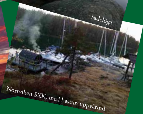
Norrviken SXX, med bastun uppvärmd