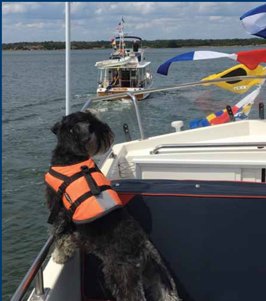
Vakthavande Grand Banks Karlskrona